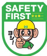
セーフティワッペン (ヨシだ君) No.44073 定価 825円