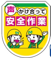
声かけ・安全作業ワッペン No.44085 定価 825円

●サイズ: H83×W50mm ●材質: ビニール ●ピン付/透明ポケット付/中紙挿入式/中紙 (H40×W15mm) 付