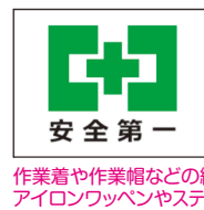
安全衛生マーク 2WAY ワッペン No.44090 定価 1,870円 5枚入

●サイズ: H37.5×W50mm ●材質: ポリエステル ※2WAY: アイロンワッペン・ステッカー両用タイプ